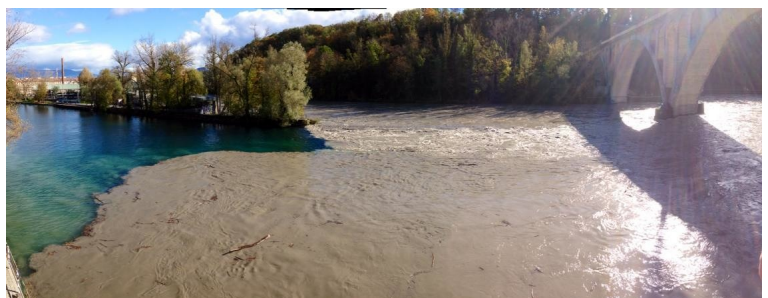
L'Arve à la Jonction, dont les eaux boueuses se mélangent avec celles limpides du Rhône

Suite à d'importantes précipitations, l'Arve était en forte crue le 3 novembre 2013: un débit de 430 m3/seconde était mesuré vers midi. Le lendemain à la même heure, il était redescendu à 170 m3/seconde. Alors que les SIG ont souvent clamé qu'ils allaient mettre en oeuvre des alternatives aux vidanges de Verbois en utilisant notamment les crues saisonnières de l'Arve pour effectuer des mini-chasses, il n'en a rien été ce jour là, car le 3 novembre ... c'était un dimanche !!!