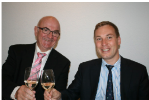
Santé ! Les conseillers nationaux André Bugnon (UDC, VD) et Lukas Reimann (UDC, SG)