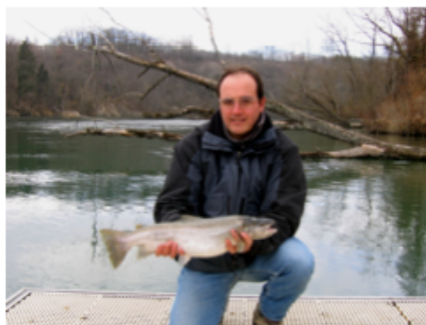
Le Rhône genevois recèle de très beaux salmonidés